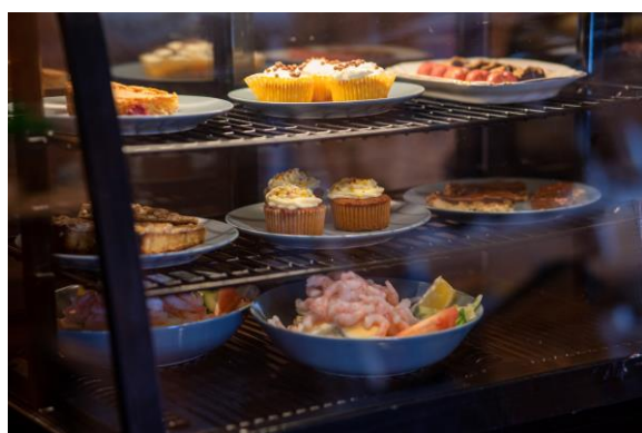
Hembakat, hemkocht och hemtrevligt!